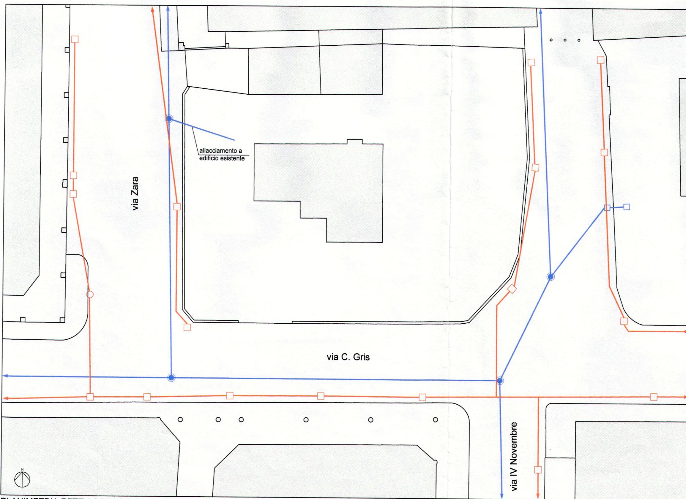
PLANIMETRIA RETE ACQUE NERE E METEORICHE